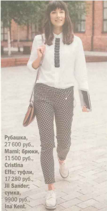
Рубашка, 27 600 руб., Marni; брюки, 11 500 руб., Cristina Effe; туфли, 17 280 руб., Jil Sander; сумка, 9900 руб., Ina Kent.