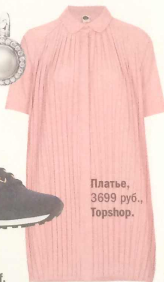
Платье, 3699 руб., Topshop.