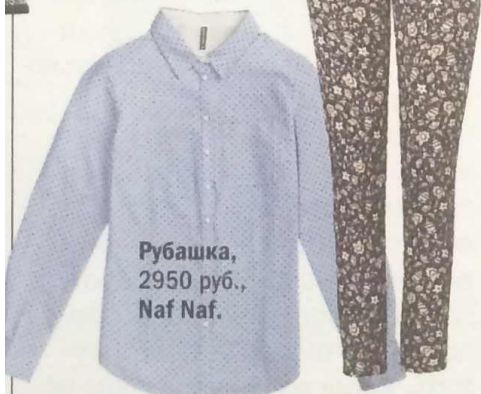
Рубашка, 2950 руб., Naf Naf.