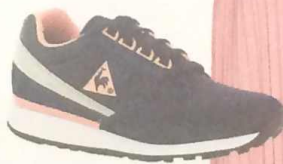
Кроссовки, 5450 руб., Le Coq Sportif.