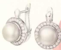
Серьги, 2792 руб., Sunlight.