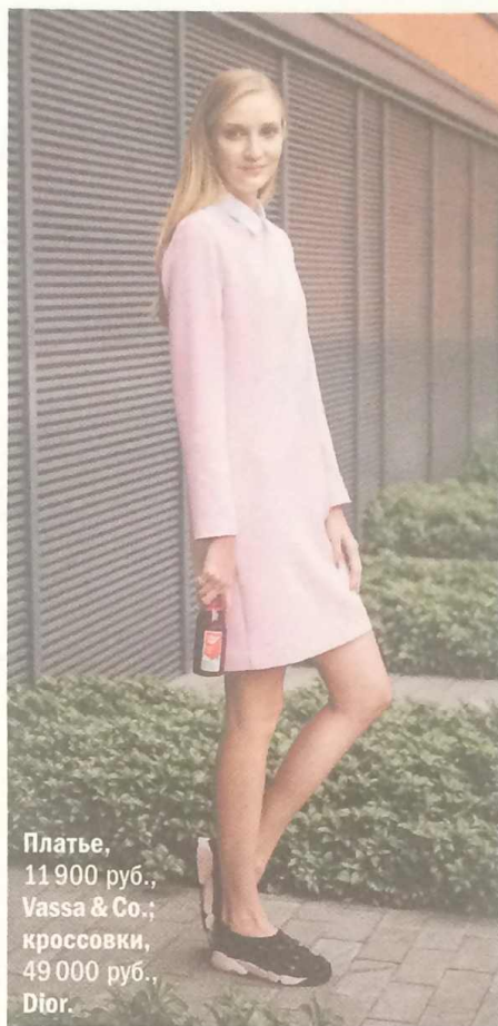
Платье, 11 900 руб., Vassa & Co.; кроссовки, 49 000 руб., Dior.